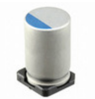
476UVG020MFF Illinois Capacitor CAP ALUM POLY 47UF 20% 20V SMD