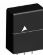
B72220T2231K105 EPCOS (TDK) VARISTOR 360V 10KA ENCASED