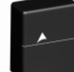
B72220T2151K105 EPCOS (TDK) VARISTOR 240V 10KA ENCASED