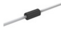
P4KE160A Littelfuse Inc. TVS DIODE 136VWM 219VC AXIAL