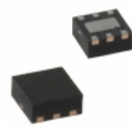
MIC5305-4.75YML-TR Microchip Technology IC REG LDO 4.75V 0.15A 6MLF