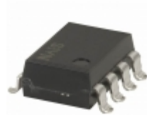
AQW410EHA Panasonic RELAY OPTO DPST-NC 100MA 8 SMD