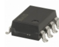
AQW284EHAX Panasonic RELAY OPTO AC/DC 400V 100MA 8SMD