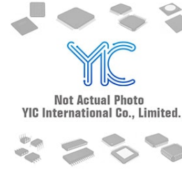
BD4742G ROHM BD4742G ROHM