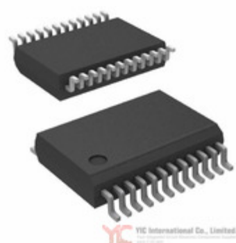
Image may be representation. See specs for product details.