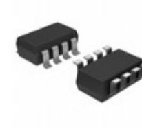
MAX4541EKA+T Maxim Integrated IC SWITCH DUAL SPST SOT23-8