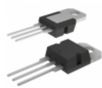
MIC29510-5.0BT Microchip Technology IC REG LDO 5A 5V TO220-3