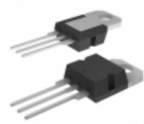
MIC29510-3.3BT Microchip Technology IC REG LDO 5A 3.3V TO220-3