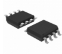
MIC2951-4.85BM-TR Microchip Technology IC REG LDO 4.85V/ADJ 0.15A 8SOIC