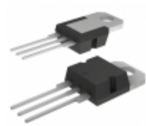
MIC29510-5.0WT Microchip Technology IC REG LDO 5A 5V TO220-3