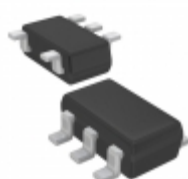
XC6121D519MR-G Torex Semiconductor Ltd IC WATCHDOG TIMER SOT-25