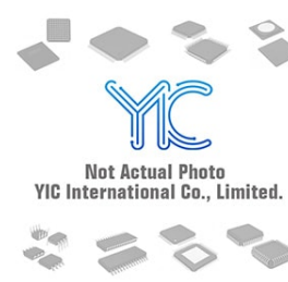
ADG439FBRNZ ADI ADG439FBRNZ ADI