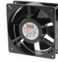
UF13A12-BWHR Mechatronics FAN AXIAL 127X38MM 115VAC WIRE