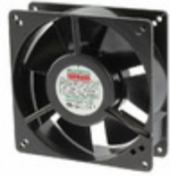
UF13A12-BWHNSR Mechatronics FAN 127X38MM 115V IP55 SALT FOG