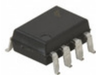
6N136SD Fairchild/ON Semiconductor OPTOISO 2.5KV TRANS W/BASE 8SMD