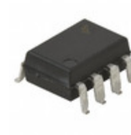
6N136SD AMI Semiconductor / ON Semiconductor OPTOISO 2.5KV TRANS W/BASE 8SMD