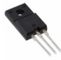
FMXA-2102ST Sanken DIODE ARRAY GP 200V 10A TO220F