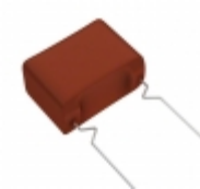
ECW-F2685HAQ Panasonic Electronic Components CAP FILM 6.8UF 3% 250VDC RADIAL