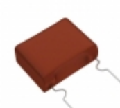
ECW-F2155RHA Panasonic Electronic Components CAP FILM 1.5UF 3% 250VDC RADIAL