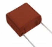
ECW-F2155JA Panasonic Electronic Components CAP FILM 1.5UF 5% 250VDC RADIAL