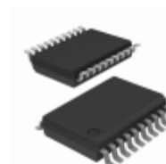
ICL3225ECA Intersil IC TXRX RS-232 3-5.5V ESD 20SSOP