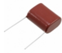
ECQ-E6185JF Panasonic Electronic Components CAP FILM 1.8UF 5% 630VDC RADIAL