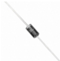
1.5KE33A-B Littelfuse Inc. TVS DIODE 28.2VWM 45.7VC AXIAL