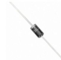
1.5KE33A Littelfuse Inc. TVS DIODE 28.2VWM 45.7VC AXIAL