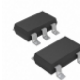
MIC5265-2.85YD5-TR Microchip Technology IC REG LDO 2.85V 0.15A TSOT23-5