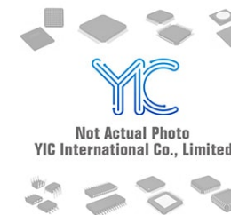
MIC5265-2.6YD5 TR MICREL MICREL SOT-153