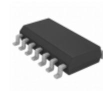
MCP6444T-E/SL Microchip Technology IC OPAMP GP 9KHZ RRO 14SOIC