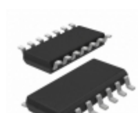
74HCT27D,652 Nexperia USA Inc. IC GATE NOR 3CH 3-INP 14-SO