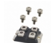
DMA150E1600NA IXYS DIODE GP 1.6KV 150A SOT227B