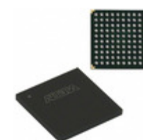
EPM7128BFC100-10N Altera IC CPLD 128MC 10NS 100FBGA