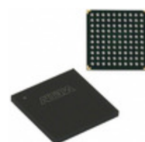
EPM7128BFC100-4N Altera IC CPLD 128MC 4NS 100FBGA