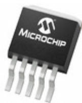
TC1263-2.8VETTR Microchip Technology IC REG LDO 2.8V 0.5A DDPACK