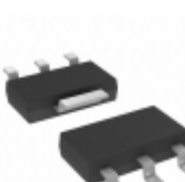
MCP1754ST-1802E/DB Microchip Technology IC REG LDO 1.8V 0.15A SOT223-3