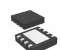
MCP1727T-ADJE/MF Microchip Technology IC REG LDO ADJ 1.5A 8DFN