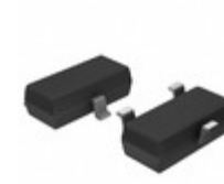
MCP1754ST-1802E/CB Microchip Technology IC REG LDO 1.8V 0.15A SOT23A-3