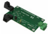
NCP4894FCEVB AMI Semiconductor / ON Semiconductor EVAL BOARD FOR NCP4894FC