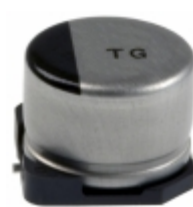
EEV-TG1E470P Panasonic Electronic Components CAP ALUM 47UF 20% 25V SMD