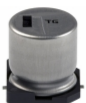
EEV-TG1E681UQ Panasonic Electronic Components CAP ALUM 680UF 20% 25V SMD