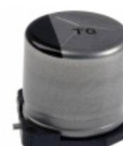
EEV-TG1E331UP Panasonic Electronic Components CAP ALUM 330UF 20% 25V SMD