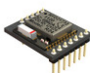
RFD21813 RF Digital Corporation RF TXRX MODULE ISM>1GHZ CHIP ANT