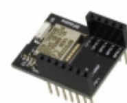
RFD22102 RF Digital Corporation RF TXRX MOD BLUETOOTH CHIP ANT