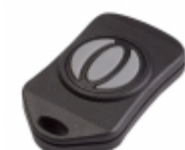
RFD21793 RF Digital Corporation RF TRANSCEIVER 2.4GHZ KEYFOB