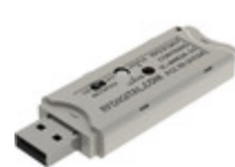
RFD21807 RF Digital Corporation TRANSCEIVER USB 2.4GHZ