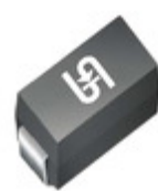
P4SMA62CA R3G TSC (Taiwan Semiconductor) TVS DIODE 53V 85V DO214AC