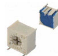
3361S-1-204GLF Bourns, Inc. TRIMMER 200K OHM 0.5W GW SIDE