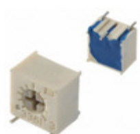
3361S-1-205G Bourns, Inc. TRIMMER 2M OHM 0.5W GW SIDE ADJ