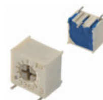
3361S-1-203GLF Bourns, Inc. TRIMMER 20K OHM 0.5W GW SIDE ADJ