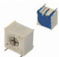
3361S-1-203G Bourns, Inc. TRIMMER 20K OHM 0.5W GW SIDE ADJ