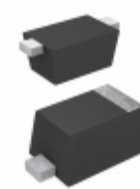
EDZVT2R18B Rohm Semiconductor DIODE ZENER 18V 150MW EMD2