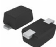
EDZVT2R27B Rohm Semiconductor DIODE ZENER 27V 150MW EMD2