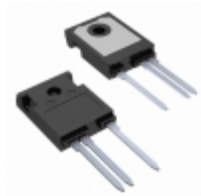
IXTH06N220P3HV IXYS Corporation MOSFET N-CH