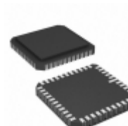
AT28C010E-12LM/883 Micrel / Microchip Technology IC EEPROM 1MBIT 120NS 44CLCC