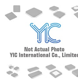
CY2907SL-336 CYPRESS CY2907SL-336 CYPRESS