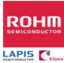
TFZVTR4.3C ROHM ROHM TUMD2M