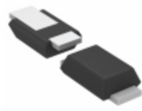
TFZVTR39B Rohm Semiconductor ZENER DIODE