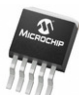
MCP1825-3302E/ET Microchip Technology IC REG LDO 3.3V 0.5A DDPACK