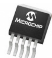
MCP1825-5002E/ET Microchip Technology IC REG LDO 5V 0.5A DDPACK