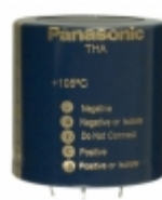
ECE-P2AA822HA Panasonic Electronic Components CAP ALUM 8200UF 20% 100V SNAP