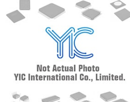
ICL7667MJA INT ICL7667MJA INT