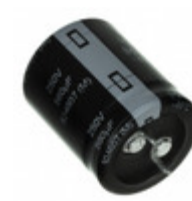
EET-UQ2W271CA Panasonic Electronic Components CAP ALUM 270UF 20% 450V SNAP