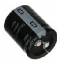
EET-UQ2W221JA Panasonic Electronic Components CAP ALUM 220UF 20% 450V SNAP