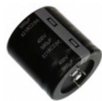
EET-UQ2W221EA Panasonic Electronic Components CAP ALUM 220UF 20% 450V SNAP