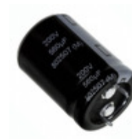
EET-UQ2W221HA Panasonic Electronic Components CAP ALUM 220UF 20% 450V SNAP