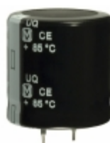
EET-UQ2W221DA Panasonic Electronic Components CAP ALUM 220UF 20% 450V SNAP