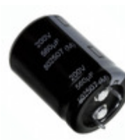
EET-UQ2W271BA Panasonic Electronic Components CAP ALUM 270UF 20% 450V SNAP