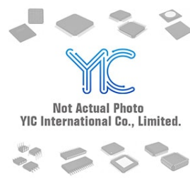
BCX70JLT1 ON BCX70JLT1 ON