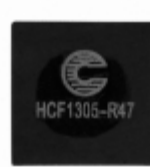
HCF1305-R47-R Eaton FIXED IND 470NH 32A 1 MOHM SMD