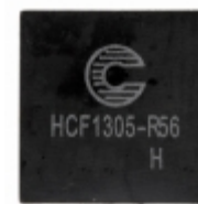
HCF1305-R56-R Eaton FIXED IND 560NH 32A 1 MOHM SMD