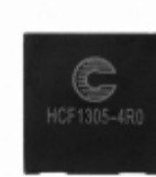
HCF1305-4R0-R Eaton FIXED IND 4UH 10.9A 7.2 MOHM SMD