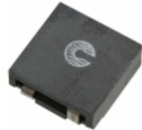
HCF1305-4R7-R Eaton FIXED IND 4.7UH 10.9A 7.2 MOHM