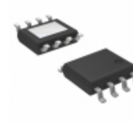
AP7361C-15SPR-13 Diodes Incorporated IC REG LDO 1.5V 1A 8-SO