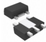
AP7361C-15Y5-13 Diodes Incorporated IC REG LDO 1.5V 1A SOT89-5