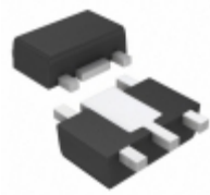
AP7361C-18Y5-13 Diodes Incorporated IC REG LDO 1.8V 1A SOT89-5