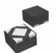
MCP1711T-22I/5X Microchip Technology IC REG LDO 2.2V 0.15A 4UQFN