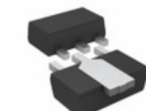
2SAR514P5T100 Rohm Semiconductor PNP -80V -0.7A MEDIUM POWER TRAN