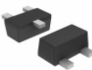
2SAR522EBTL Rohm Semiconductor TRANS PNP 20V 0.2A EMT3F