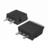
STPSC20065GY-TR STMicroelectronics DIODES AND RECTIFIERS