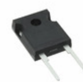
STPSC20065WY STMicroelectronics DIODE SCHOTTKY 650V 20A DO247