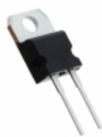
STPSC20065DY STMicroelectronics DIODE SCHTKY 650V 20A TO220AC