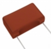
ECW-FA2J125J Panasonic Electronic Components CAP FILM 1.2UF 5% 630VDC RADIAL