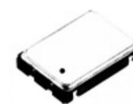
SG-8002CE 64.0000M-PCMB Epson OSC XO 64MHZ CMOS SMD