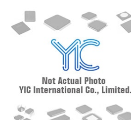
PJ03TPLCFN2 PANJIT PANJIT DFN1006