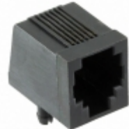
PJ006-6P6C1 On Shore Technology Inc. CONN MOD JACK 6P6C R/A UNSHLD