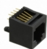
PJ012-8P8C1 On Shore Technology Inc. 8 POS. 8 CONTACT TOP ENTRY THRU