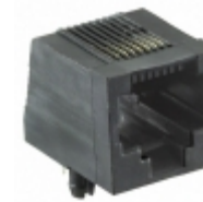
PJ006-8P8C1 On Shore Technology Inc. CONN MOD JACK 8P8C R/A UNSHLD