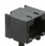
PJ068-8P8C6 On Shore Technology Inc. 8 POS. 8 CONTACT SIDE ENTRY THRU