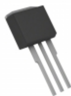
IRF3704ZCLPBF Infineon Technologies MOSFET N-CH 20V 67A TO-262